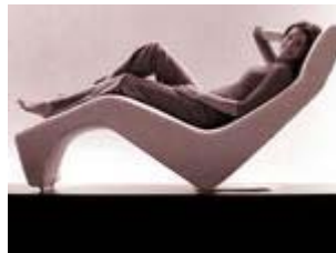
Gesundes Wohnen

Nicht nur das eigene Haus oder die Wohnung an sich spielen eine Rolle beim ökologische Wohnen, sondern natürlich auch die Einrichtung. Wer neben Stil und Bequemlichkeit bei Möbeln außerdem Wert auf Umweltverträglichkeit legt, für den kommen "Eco-Möbel" in Frage. Ein Netzwerk aus Entsorgern, Handwerkern und Händlern bietet im Internet Gebrauchtmöbel an, die auf Schadstoffe